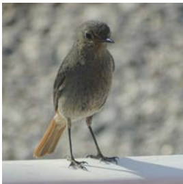
Der junge Hausrotschwanz.