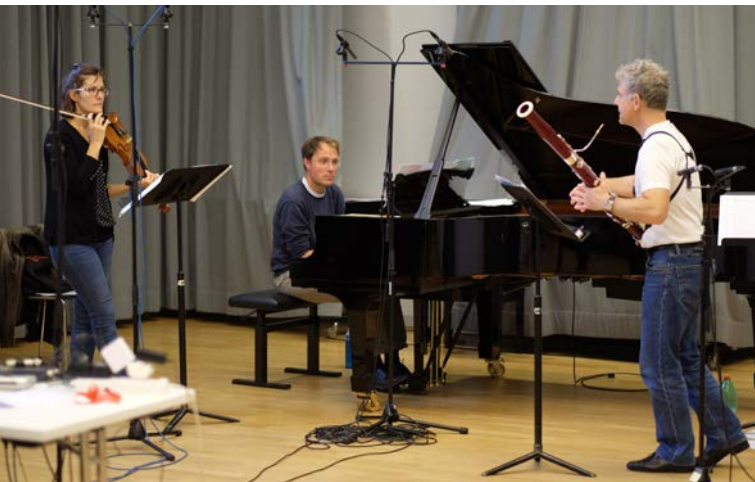
Aufnahme dieser CD in der Aula der Musikschule Zug.